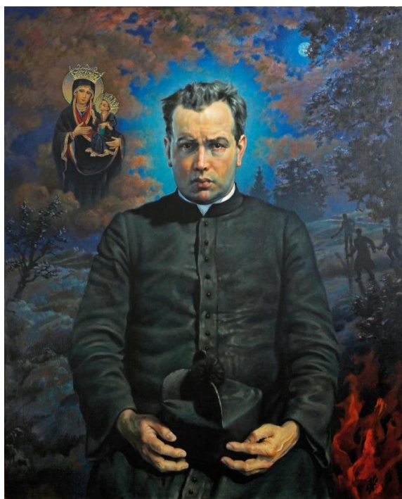
PROBOSZCZ W PŁOKACH MĘCZENNIK ZA WIARĘ I MIŁOŚĆ

Poniższe materiały przybliżają Jego sylwetkę, pokazując jaką drogą szedł do świętości.