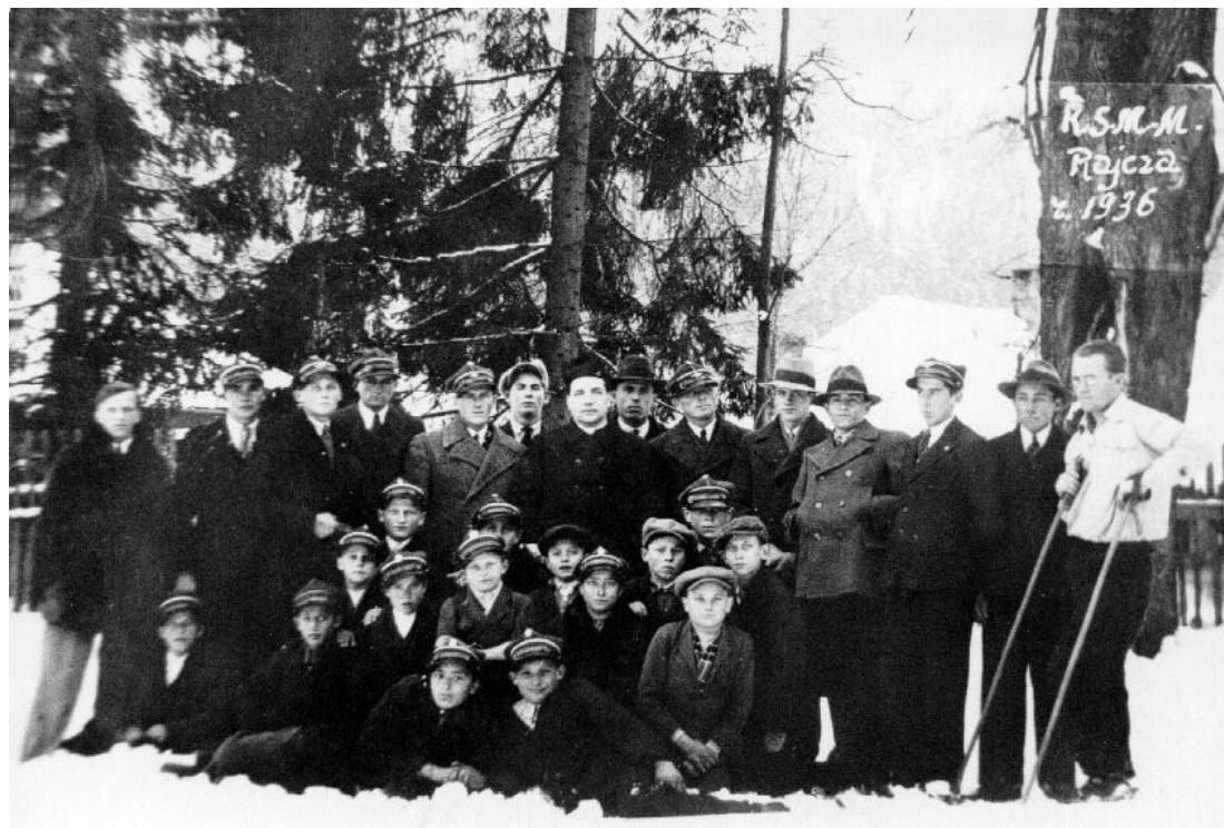
KSM w Rajczy