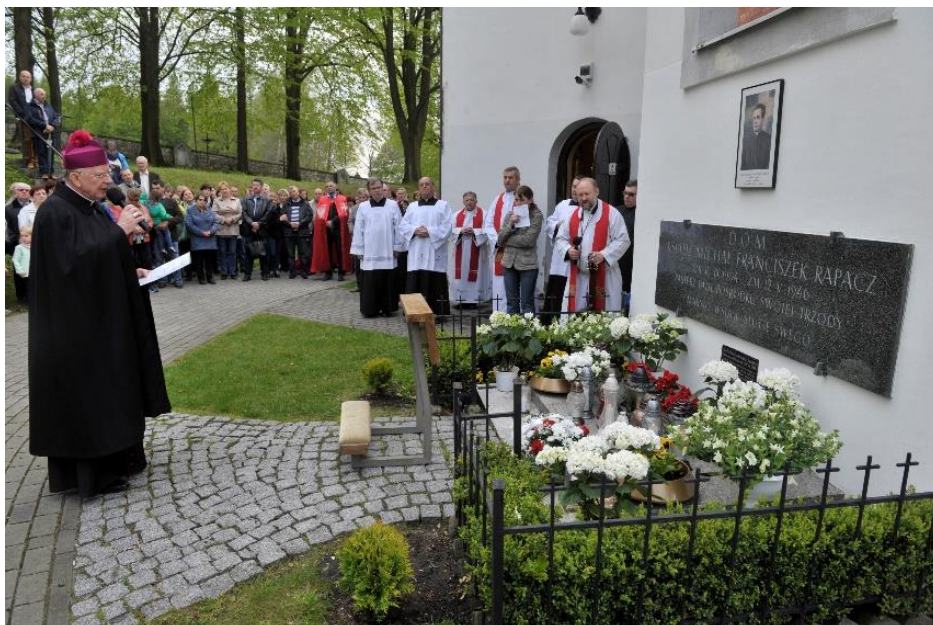
Abp Marek Jędraszewski